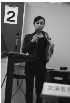
裏勝りの「いき」を表現した作品を着装して発表