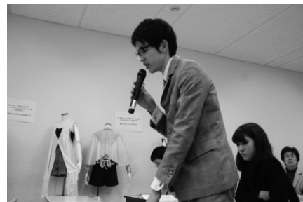
熱心に質問をする杉野服飾大学の学生